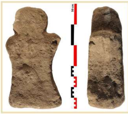
Buste gaulois découvert près de la chapelle de Saint-Cyrice de l'Ifernet, commune du Truel