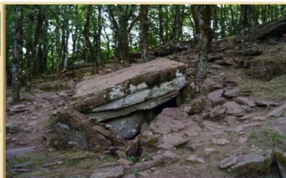
Mégalithe du Bois de Moussu à Mounès-Prohencoux (découverte et cl. M. Maillé, ASPAA).