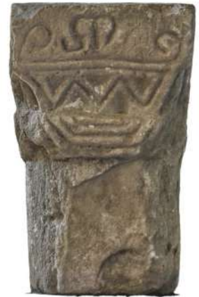
Chapiteau vraisemblablement carolingien de l'église d'Amalou au Viala-du-Tarn.