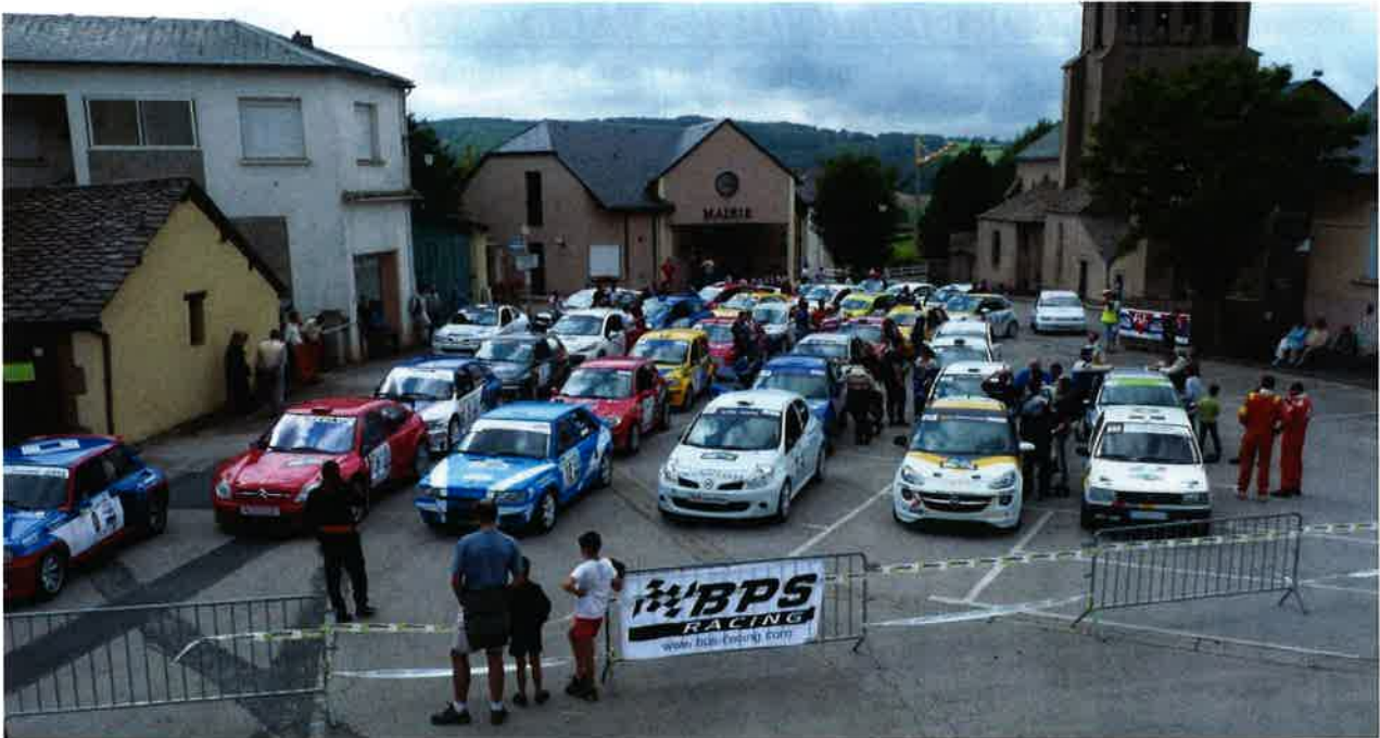
Parc de regroupement sur la place

Merci à tous les pilotes pour leur disponibilité, merci également à tous les partenaires locaux qui se sont fortement impliqués pour la réussite de cette épreuve (Conseil Régional, Conseil Général, Municipalités, Commerçants, Artisans, Agriculteurs et Entreprises) et surtout merci aux bénévoles.