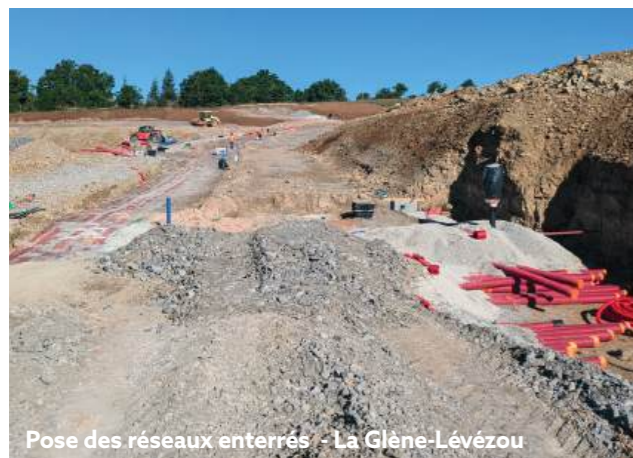
Pose des réseaux enterrés - La Glène-Lévezou